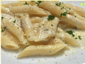
ペンネゴルゴンゾーラ