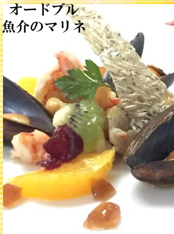
オードブル 魚介のマリネ