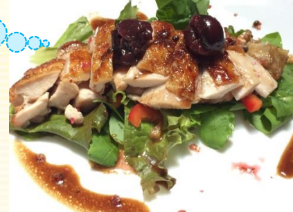
夏野菜とグリルチキン バルサミコソース